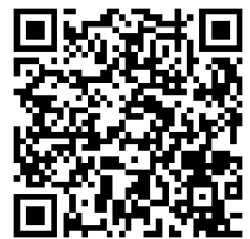
参加申込フォーム